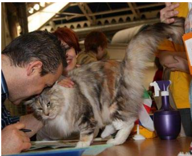
(Лючия и Судья...)

А вот если вы держите целый питомник породистых кошек, участвуете в международных выставках, получаете заслуженные призы, и за котятами из вашего питомника выстраиваются очередь желающих приобрести их – значит, ваше хобби стало самокупаемым, и это уже бизнес. Ваш маленький личный бизнес.